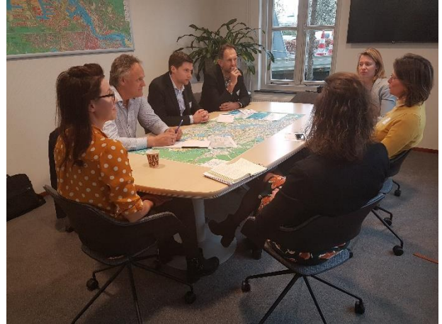
Rondetafelbijeenkomst op 3 april 2019 met de Havenklopers, georganiseerd door PSR, Park-line Aqua en de NVB