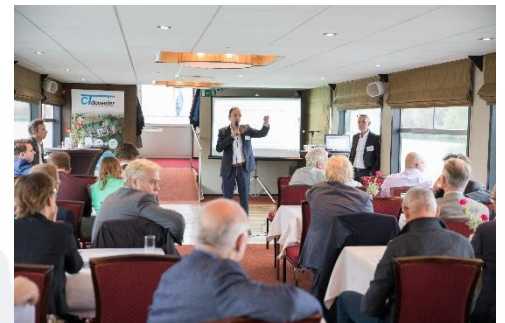
Het middagprogramma van het congres op 4 oktober 2019 bestond uit excursies naar Port of Twente, Port of Zwolle en Port of Deventer. Deelnemers konden kiezen naar welke haven zij wilden gaan.